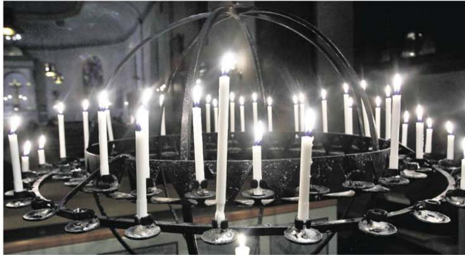
Ljushållaren i Varbergs kyrka. Medlemmarnas engagemang välkomnas, skriver kyrkorådet.