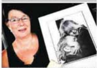
En bild av människor i Falkenberg